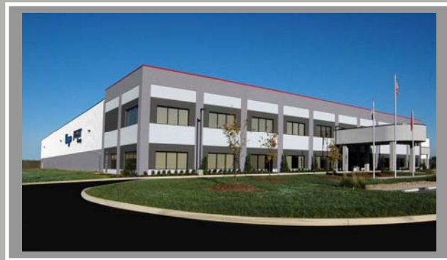
Koyo USA 光洋精工