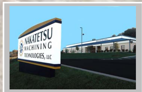
ナカテツ マシーニング テクノロジーズ

当社は多大なる リソース(Resources) と 責任(Responsibility) を持ってお客様に最高の 結果(Results) をご提供いたします。そのように100年近くの間貫いて参りました。