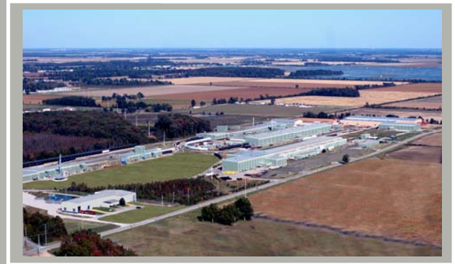
アメリカンレールカー